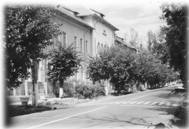
Clădirea liceului în 1964

Din anul școlar 1964-1965, se transformă în liceu mixt cu durata de 12 ani: ciclul I - 4 clase elementare; ciclul II - 4 clase gimnaziale (V, VI, VII, VIII) și 4 clase liceale (IX, X, XI, XII), purtând numele de Liceul nr. 1 Roșiorii de Vede.